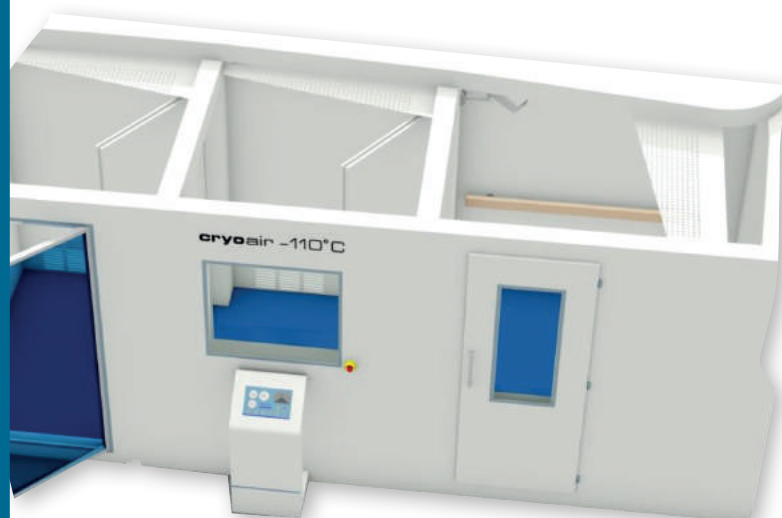
Chambre de Cryothérapie Corps entier Cryospace 3 chambres -110°C