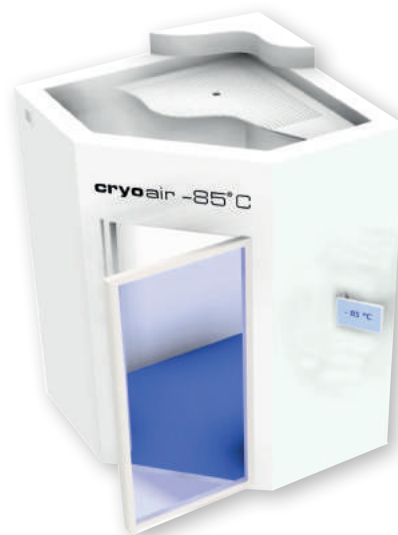
Chambre de Cryothérapie Corps entier Cryospace 1 chambre -85°C

Une visite médicale préalable et un consentement éclairé du patient sont conseillés.